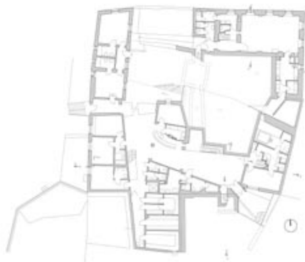
Půdorys prvního suterénu