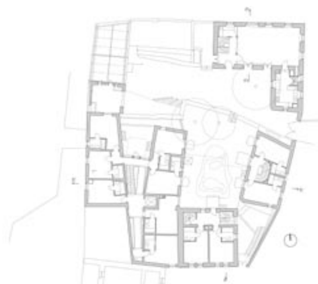
Půdorys prvního patra